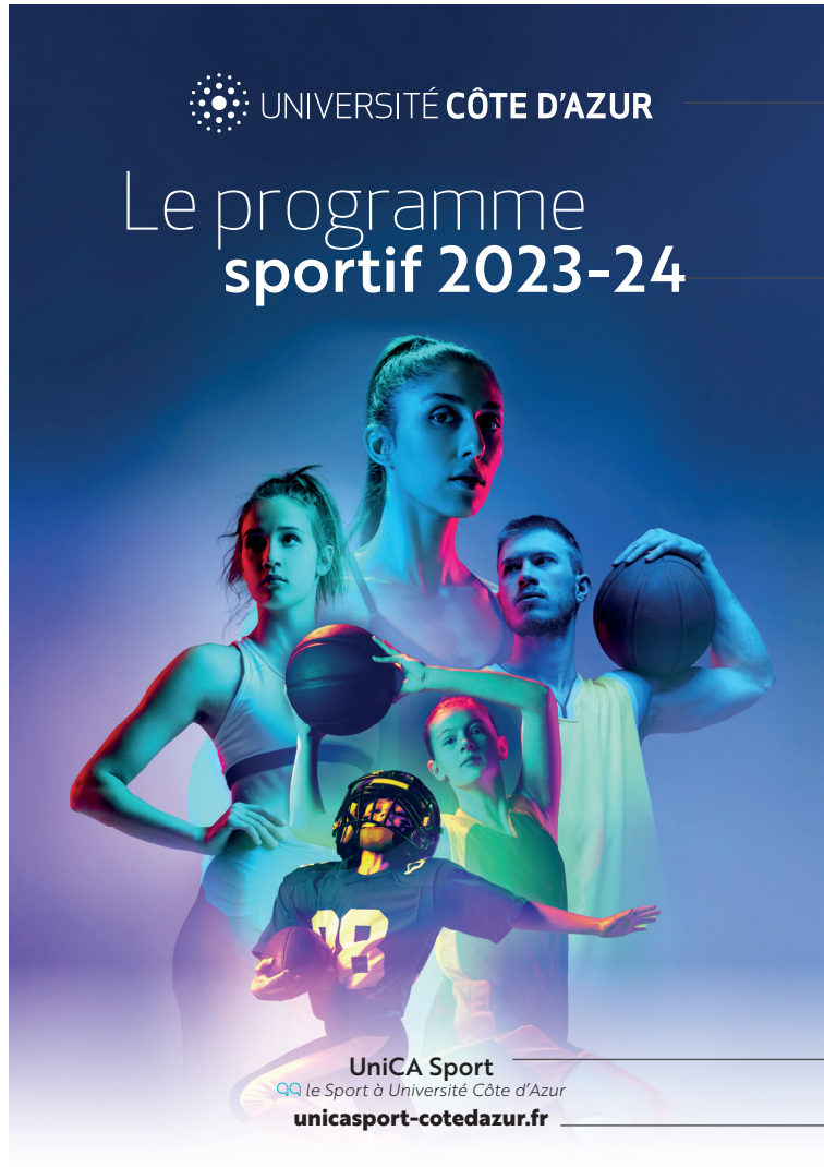
Exemple de communication sur les réseaux sociaux

Utilisation du logo Université Côte d'Azur en quadri ou en noir et blanc selon la photo d'arrière-plan