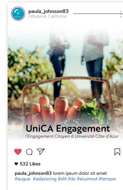
Exemple de communication sur les réseaux sociaux

Utilisation de l'acronyme et sa signature en bas de page Mention du site web