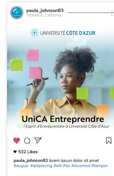
Exemple de communication sur les réseaux sociaux

Utilisation de l'acronyme et sa signature en bas de page Mention du site web