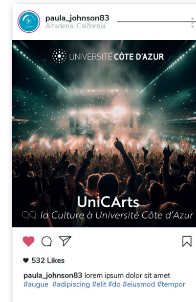
Exemple de communication sur les réseaux sociaux

Utilisation de l'acronyme et sa signature en bas de page Mention du site web